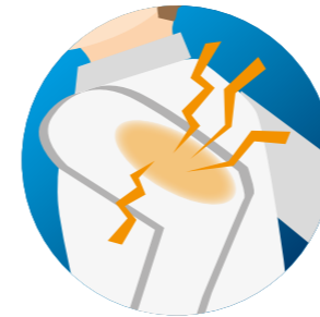
DOULEURS MUSCULAIRES (COURBATURES)