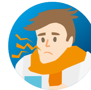
MAUX DE GORGE