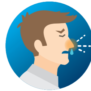
NEUSVERKOUDEHEID (VERSTOPTE NEUS, LOOPNEUS)