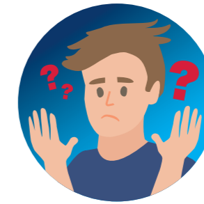
PLOTSE VERWARD- HEID EN EEN PLOTSE VAL (BIJ OUDERE PERSONEN)