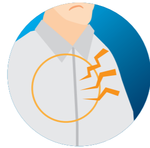
PIJN OP DE BORST